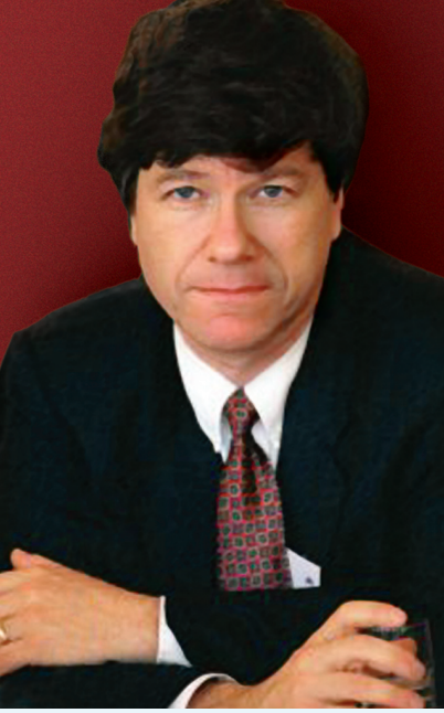
Jeffrey Sachs, Columbia Üniversitesi’nde Ekonomi Profesörlüğü ve Dünya Enstitüsü’nde Direktör görevini yürütmektedir.

Üçüncü sorun, küresel bilim insanları ile politikacılar arasındaki iletişimsizliktir. Bilim insanları ve mühendisler, gıda ürünü yetiştirilmesi, hastalıkların denetim altına alınması veya çevrenin korunması gibi konularda bugünün sorunlarına yönelik sağlam birçok yöntem geliştirdiler. Ve bu yöntem-