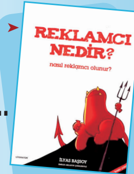
Reklamcı Nedir? / Nasıl Reklamcı Olunur? İlyas Başsoy Literatür Yayınları 124 Sayfa, Ağustos 2008 İstanbul

"Akıllı" ve "iyi" bir insan nasıl "aptal" ve "kötü" olur? Güneşin değerini gündüzden biliyor musunuz? Gitgide sığılan bir suda boğulmaya hazır mısınız? Ve daha onlarca sorunuza yanıtı kitabı okurken bulacaksınız.