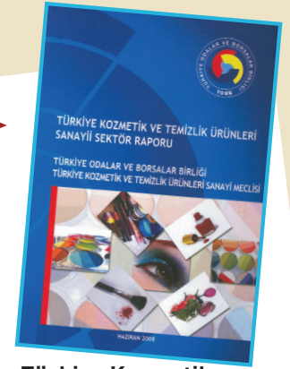
Türkiye Kozmetik ve Temizlik Ürünleri Sanayi Sektör Raporu

TOBB "Türkiye Kozmetik ve Temizlik Ürünleri Sanayi Meclisi" tarafından "Türkiye Kozmetik ve Temizlik Ürünleri Sanayi Sektör Raporu" yayımlandı. Raporda sektörün Türkiye ekonomisi içindeki yeri kapsamlı olarak irdeleniyor ve analizi yapılıyor. Ayrıca sektörün yatırım ortamının iyileştirilmesi ile bölgesel teşvik ve yardımlarını, dış piyasalardaki durumu ele alınarak, yapısal sorunları ve çözüm yolları üzerinde duruluyor. AB sürecinde karşılaşılan uyum sorunlarını ve sektörün ihtiyaçları açısından yapılması gerekenler ayrı bir bölümde detaylı olarak değerlendiriliyor.