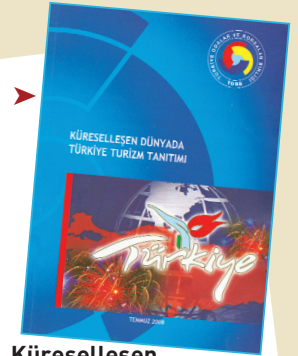
Küreselleşen Dünyada Türkiye Turizm Tanıtımı

Dünya turizmindeki gelişmeler dikkate alınarak Türk turizminin geçirmiş olduğu evreler, Kültür ve Turizm Bakanlığı tarafından tanıtım ve pazarlamada uygulanan yöntemler, uygulamada karşılaşılan darboğazlar ve kısıtlar üzerinde durularak önerilen yeni model ile sektörün çağdaş, etkin, rekabet edebilir bir yapıya kavuşturulması için gerekli görülen yapısal dönüşümün esaslarının ele alındığı bir çalışma olan "Küreselleşen Dünyada Türkiye Turizm Tanıtımı"nda yeni örgütlenme modeline ilişkin kanun tasarısı da bu çalışmanın ekinde yer alıyor.