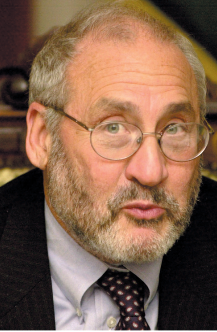
Joseph E. Stiglitz, Columbia Üniversitesi'nde Profesör ve 2001 Nobel Ekonomi Ödülü sahibidir. Çıkacak olan kitabı Freefall (Serbest Düşüş) bu kış yayımlanacaktır.