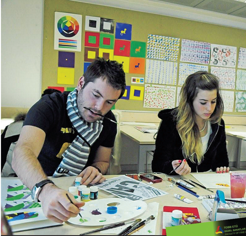
» TOBB ETÜ Güzel Sanatlar Fakültesi Sanat ve Tasarım Bölümü öğrencileri afiş çalışmalarlarıyla farklılıklarını sergiliyor.