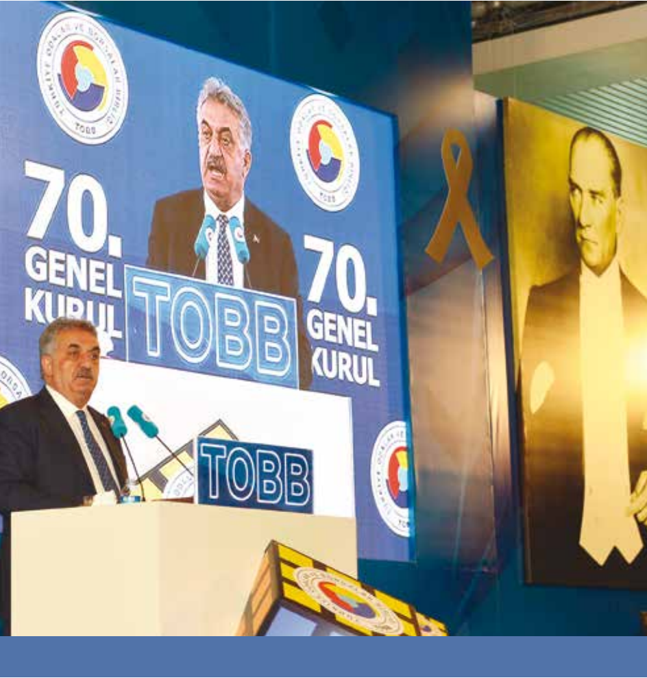
GÜMRÜK VE TİCARET BAKANİ HAYATİ YAZICI: