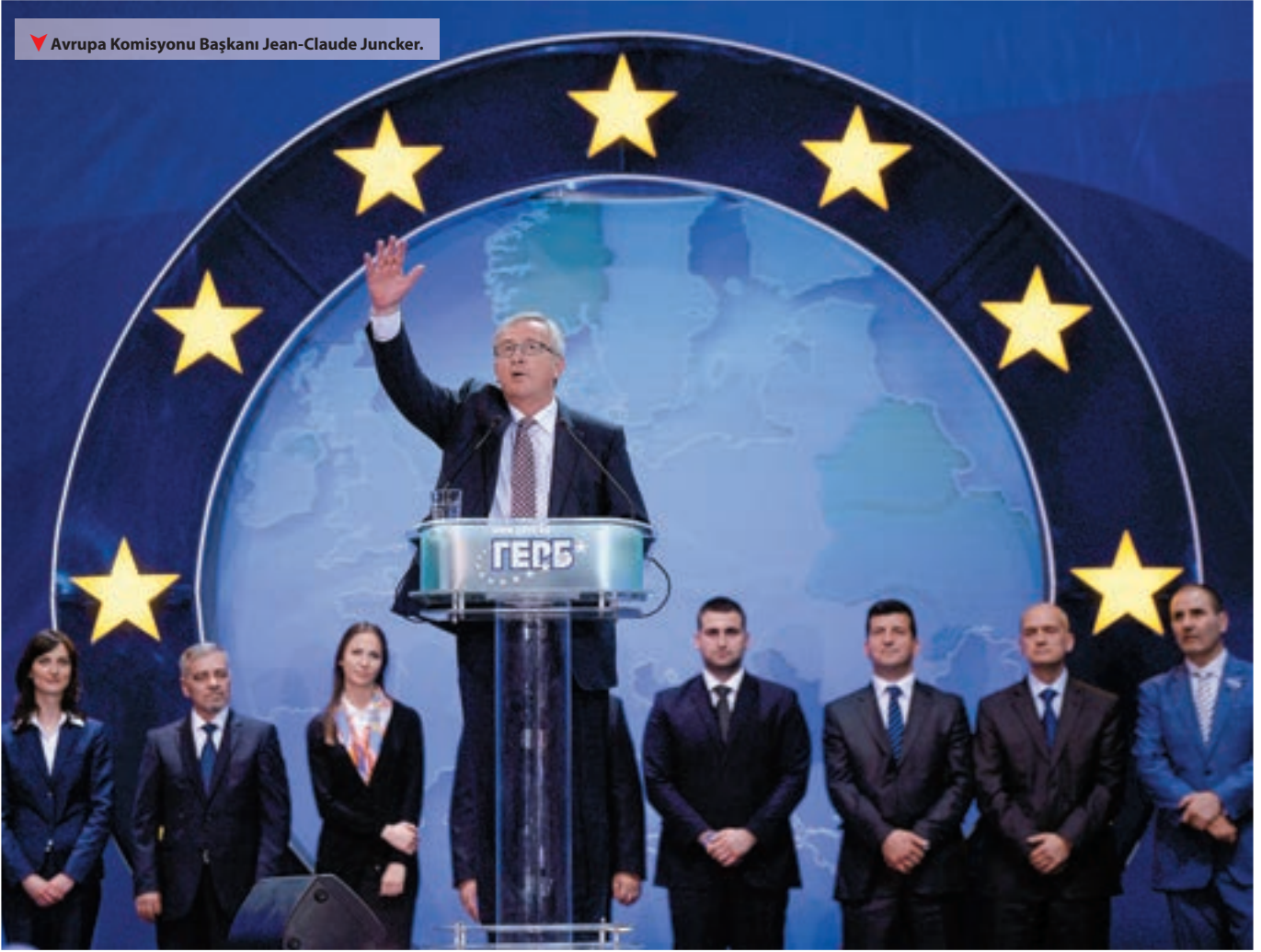
▼ Avrupa Komisyonu Başkanı Jean-Claude Juncker.

lebileceklerini söylemek mümkün. Seçim sonuçlarına bakarak içeride artan Avrupa kuşkuculuk ile mücadele etmeleri gerektiğini farkına varan entegrasyoncu elitlerin, bir yandan da Ukrayna krizinin ortaya koyduğu AB'nin küresel bir aktör olarak inandırıcılık sorununu çözmeleri ve AB'yi yeniden küresel arenada saygı duyulan bir hasım haline getirmeleri gerekiyor. Bu yolda sorumluluğun büyük bölümü AP tarafından Avrupa Komisyon Başkanlığı 15 Temmuz'da onaylanan Jean-Claude Juncker'in omuzlarında. Avrupa içinde değişen dinamiklere gebe olması beklenen bu süreç ve oluşacak yeni Komisyon'un genişleme politikası konusundaki tutumu Türkiye'nin AB'ye katılım süreci için oldukça belirleyici olacağı öngörülüyor.