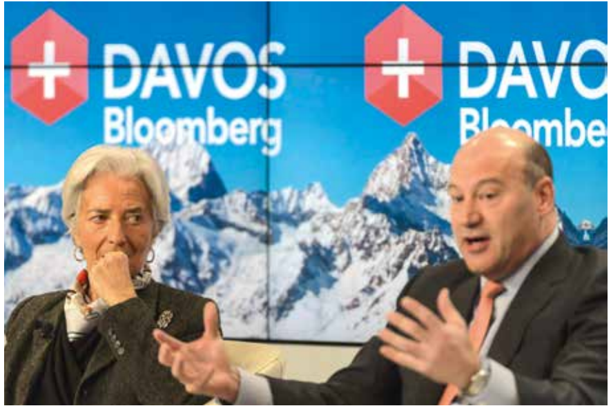
▲ IMF Başkanı Christine Lagarde ile Goldman Sachs Başkanı Gary D. Cohn Davos’ta düzenlenen panele katıldı.

Umut verici gelişmelerle kaygı verici gelişmeler arasında nasıl bir denge kurulacağını ve dünya ekonomisinin 2015 yılında nasıl bir performans sergileyeceğini siyasi gelişmeler de etkileyecekti kuşkusuz. Davos’ta ekonomiyle ilgili oturumlarda en çok kullanılan deyim “yapısal reform” idi. Ancak siyasi desteği güçlü olmayan hükümetlerin çeşitli toplumsal kesimleri etkileyecek olan