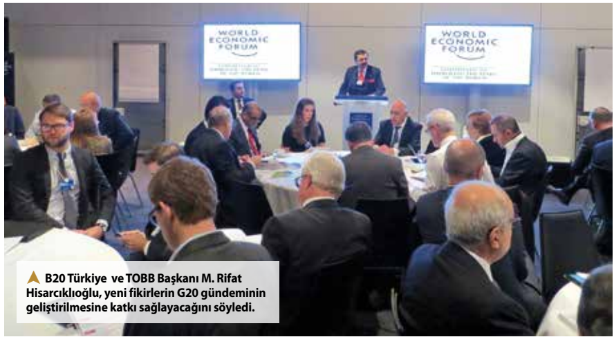
▲ B20 Türkiye ve TOBB Başkanı M. Rifat Hisarcıkloğlu, yeni fikirlerin G20 gündeminin geliştirilmesine katkı sağlayacağını söyledi.