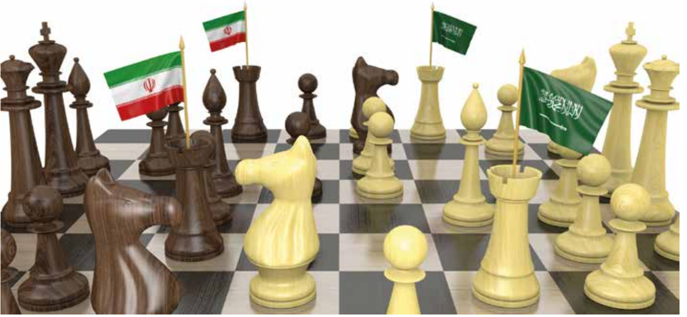
Suudi Arabistan ile İran arasındaki gerginlik stratejik ataklarla sürüyor.

ge ülkelerince tepki çekti. Son dönemde İran'ın ABD ve Batı dünyasıyla yakınlaşması, nükleer anlaşmada varılan olumlu noktalar, Suriye ile Irak'ta artan nüfuzu ve Yemen krizinde elinin güçlenmesi gibi nedenler, Suudi Arabistan'ı rahatsız etti.