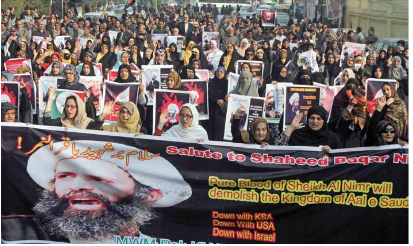
Şii Müslümanlar, 47 mahkumun idam edilmesini düzenledikleri gösterilerle kınadılar.