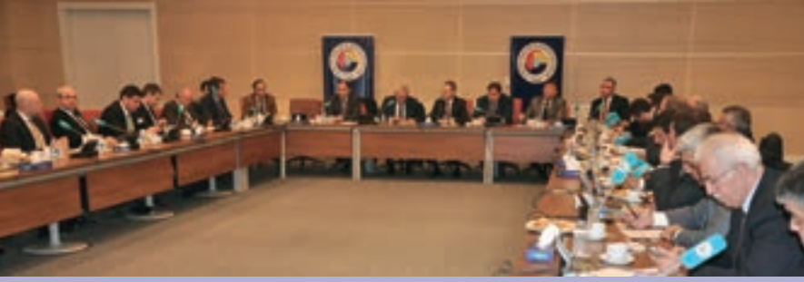
▲ TOBB TÜRKİYE DOĞAL GAZ MECLİSİ