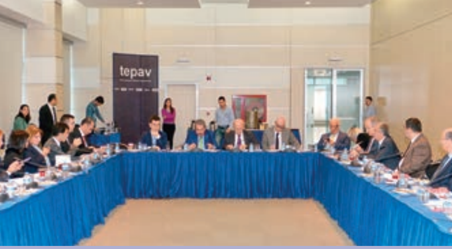
▲ TOBB TÜRKİYE DEMİR VE DEMİR DIŞI METALLER MECLİSİ