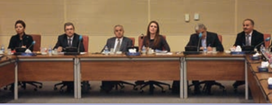
▲ TOBB TÜRKİYE EĞİTİM MECLİSİ