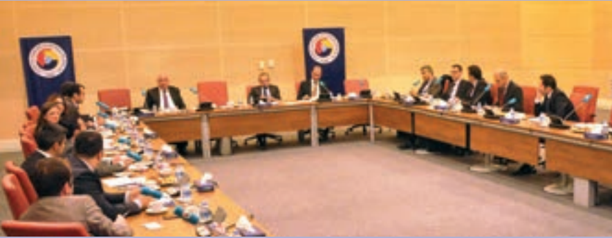
▲ TOBB TÜRKİYE OTOMOTİV SANAYİ MECLİSİ