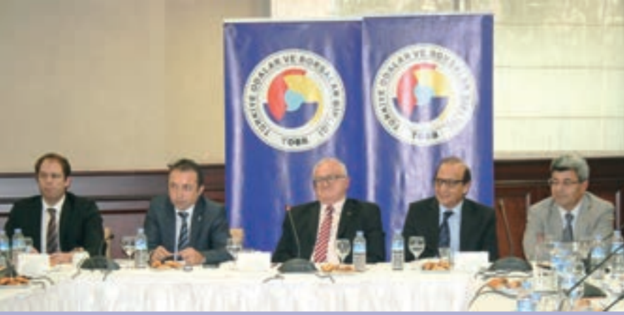
▲ TOBB TÜRKİYE KİMYA SANAYİ MECLİSİ