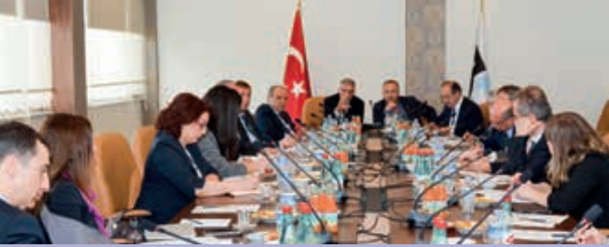
▲ TOBB TÜRKİYE GIDA SANAYİ MECLİSİ