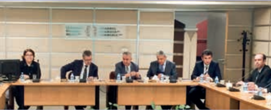
▲ TOBB TÜRKİYE EĞİTİM MECLİSİ