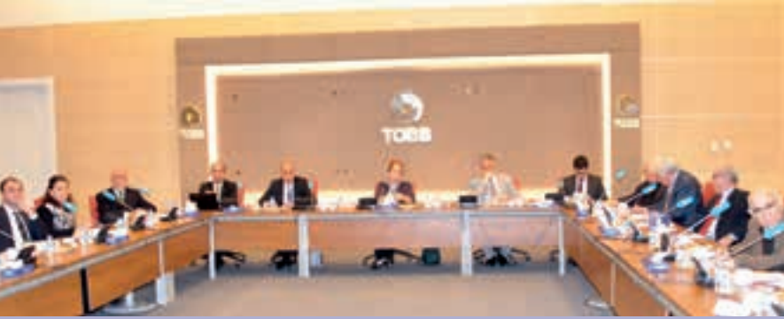
▲ TOBB TÜRKİYE TEKNİK MÜŞAVİRLİK MECLİSİ