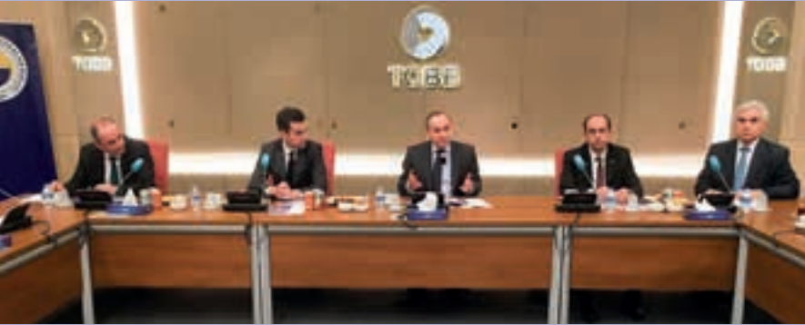
▲ TOBB TÜRKİYE OTOMOTİV SANAYİ MECLİSİ