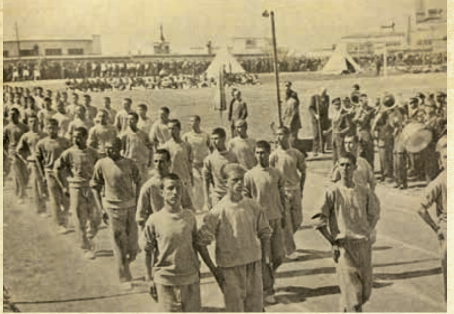
Sümerbank sporcuları, bir geçit töreninde.

Fabrika açılmadan fabrikanın ihtiyacı pamuğu yetiştirmek için 200 adet modern tohum ekme makinesi getirildi. Traktör, römork ve benzer tarım araçları Nazilli'ye getirildi, kullanılması çiftçilere öğretildi. Esnafın kazancı arttı, oteller, lokantalar açıldı. Nazilli şehir görünümü