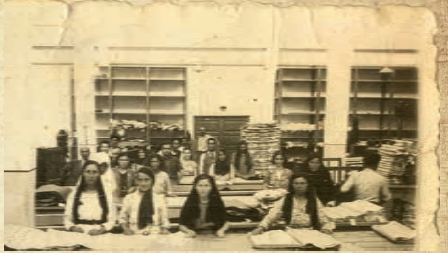
1938 yılı Nazilli Basma Fabrikası katlama dairesi çalışanları.

Sümerbank'ın kuruluşunda İsmet İnönü'nün başkanlığında Türk hükümet heyetinin Nisan-Mayıs 1932 tarihlerinde Sovyet Birliği'ne yaptığı ziyaretin önemi büyüktür. 6 Mayıs 1932'de İ. İnönü ile İ.V. Stalin arasında ikili görüşme yapıldı. Bu görüşmede Sovyet yönetimi ile bir anlaşma yapıldı.