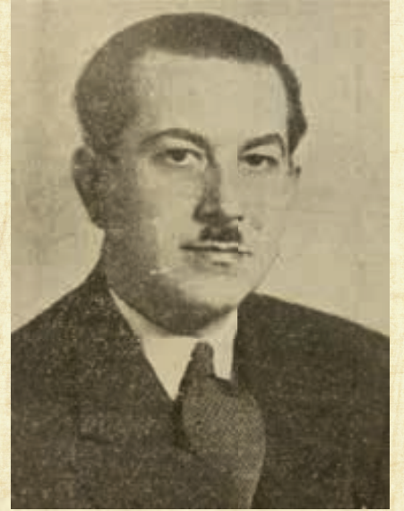
Nurullah Esat Sümer

Türkiye'nin sanayi okulu, Sümerbank, başta tekstil ve giyim sanayisi olmak üzere imalat sanayisi alanlarında yatırım, kuruculuk, işletmecilik ve bankacılık yapmak, her türlü mal ve hizmetin üretimi, pazarlanması,