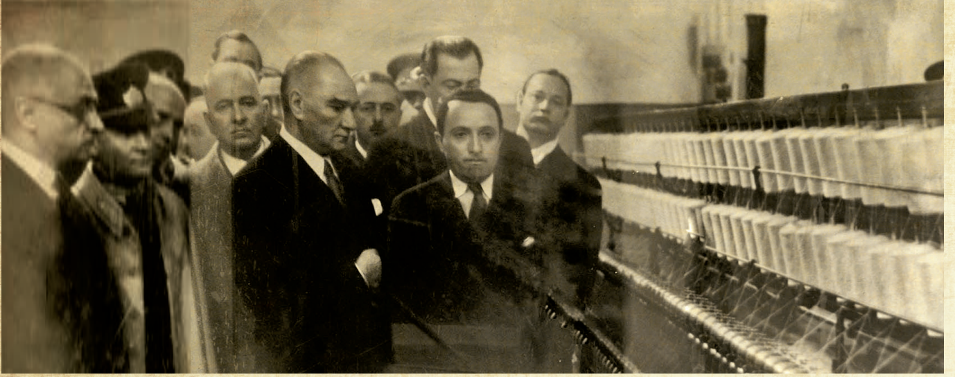
Atatürk, Merinos Fabrikası açılışı sonrası fabrikayı gezerken (2 Şubat 1938).