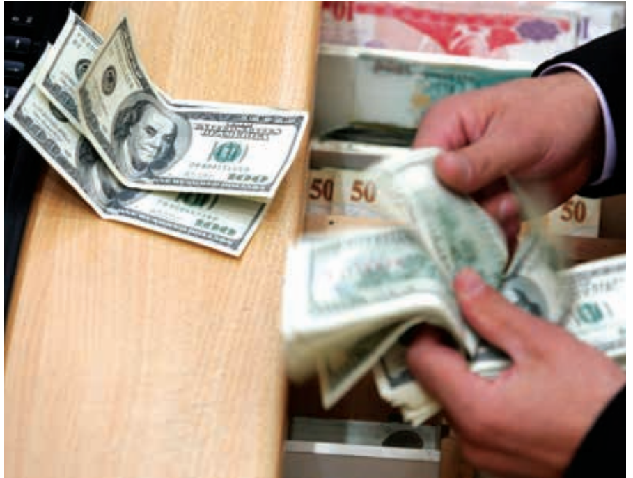
Açık pozisyon nasıl seyrediyor? (Milyar dolar)