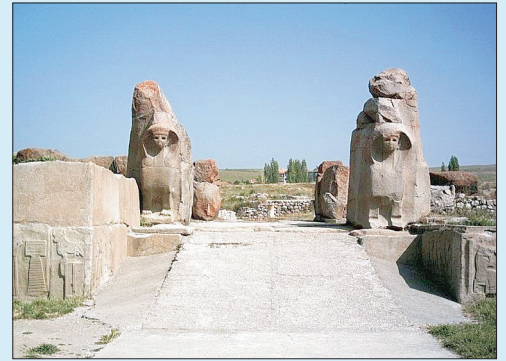
Medeniyetlerin beşiği Hititlerin başkenti Hattuşa'da Aslanlı Kapı (üstte) ve Kral Kapısı (altta) Çorum Alacahöyük kazı çalışmalarında ortaya çıkarılarak ziyarete açıldı.

Bin tanrılı kent olarak adlandırılan Hattuşa, büyük ölçüde tapınaklar ve kamu binaları kenti. Hitit başkentinde belki de en özenle yapılmış olan yer burası. Kentin kapıları ayrıca görülmeye değer. Aslanlı kapı, Sfensli Kapı, Yer Kapısı ve Kral Kapısı. Yer kapıdan geç-