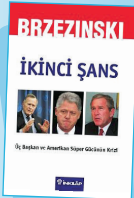
İkinci Şans / Üç Başkan ve Amerikan Süper Gücünün Krizi

Son üç başkanın yönetimi -Baba Bush, Clinton ve Oğul Bush- yirmi yıldan az sürdü, ama dönüm noktası olarak önemli bir zamanı kapsadı: Amerika Birleşik Devletleri'nin Soğuk Savaş'ın tartışmasız galibi olmasından sonra dünya tarihinde emsali görülmemiş ölçüde uluslararası hâkimiyetin tadını çıkarttığı bir dönem. Bu üç Amerikan başkanı sadece devletin başı değil hakikatte dünya lideriydiler. Uluslararası ilişkiler konusunda Amerika'nın en seçkin yorumcusu Zbigniew Brzezinski ABD'nin gücünün ve prestijinin büyük kısmını çarçur ettiği sonucuna varıyor. Yansız, ama sarcısız "İkinci Şans" sadece eleştirel değerlendirme yapmakla kalmıyor, aynı zamanda Amerika'nın dünyadaki rolü için yapıcı bir rehber sunuyor.