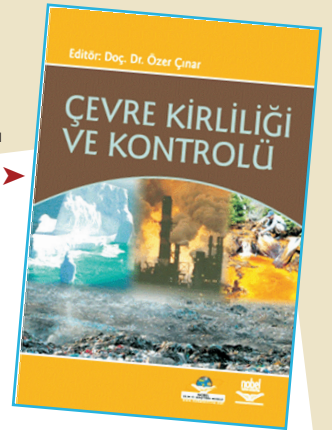
Çevre Kirliliği ve Kontrolü

Teknoloji, endüstri ve nüfusun artışında yaşanan dengesizlikler çevre kirliliğinin önemli boyutlarda artmasında neden olmaktadır. Bu kapsamda çevre kirliliğinin en büyük nedenlerinden bazıları; ülkelerin gelişmelerine dayalı kalkınmanın temel unsurlarını oluşturan, tarım, sanayi, turizm ve ulaşım sektörleridir. Dünyada olduğu gibi Türkiye'de de çevre kirliliği sorunları toplumun yeterli duyarlılık göstermemesi sebebiyle her geçen gün artmaktadır. Çevre kirliliğinden kaynaklanan sorunların çözümü, dengeyi bozmada başrol oynayan insanların alacağı önlemler ile mümkün olacaktır. Bu önlemleri tema edinen eser, beş ana bölümden oluşmaktadır. Bölümler; su kirliliği, toprak kirliliği, katı ve tehlikeli atıklar, hava kirliliği, küresel ısınma ve iklim değişikliği olarak sıralanmıştır. Her bölümde, yukarıda sıralanan sorunlar hakkında detaylı bilgi verilmiş, bu sorunların çözümüne yönelik metotlar tartışılmıştır. Çalışma hem çevre bilimleri öğrencilerine hem de konuya ilgi duyanlara faydalı olacaktır.