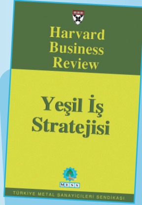
Yeşil İş Stratejisi Türkiye Metal Sanayicileri Sendikası (MESS) Yayınları

Yöneticilerin, "Yeşil olmanın bir getirisi var mı" sorusunun ötesine geçip, bunun yerine, "Belli bir çevre yatırımı hangi koşullarda hissedarlara yarar sağlar" sorusunu sormaları gerekir. İster geleneksel bir ağır sanayi dalında, isterse yatırım bankacılığı gibi "temiz" bir sektörde iş yapıyor olalım, şirketler iklim değişikliğinin etkilerini gittikçe daha fazla hissederek olacaktır. Küresel ısınma tehlikesine kuşkuyla gözlerle bakanlar bile, kendileri dışında çok sayıda insanın endişelenmesi nedeniyle, bu olgunun çok kapsamlı sonuçları olduğunu kabul ediyorlar. Ve artık tüketiciler bir şeyi satın almaya karar verirken şirketlerin çevre sicillerini de dikkate alıyorlar. İşte tam da bu noktada çevre sorunlarının çözümüne yönelik ürün ve hizmetler sunabilecek teknolojiye ve vizyona sahip şirketler rekabet üstünlüğünün keyfini çıkartacaklardır. Başka bir şekilde ifade edecek olursak, iyi şeyler yaparak sadece başarılı olmakla kalmayacaklar, daha da başarılı olacaklardır. Harvard Business Review Serisi'nden Seçmeler dizisinin 43. kitabı olan "Yeşil İş Stratejisi" sürdürülebilir çevreci stratejiler geliştirme konusunda son yıllarda çeşitli ülkelerde kazanılmış deneyimleri irdeleyen sekiz makale ile gelecekte daha da önem kazanacak bu konuda okura ufuk açıcı fikirler sunuyor.