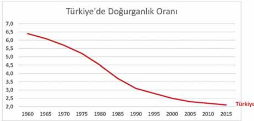
Şekil 2: Türkiye doğurganlık oranı, 1960 (6.37 doğum/kadın) - 2016 (2.05 doğum/kadın)