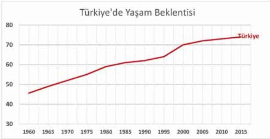
Şekil 1: Türkiye'de yaşam beklentisi (1960'da 45.6 yıl, 2016'da 75.8 yıl)

► 90 eğitim fakültesinin 2018 yılındaki toplam kontenjanı: 44,000